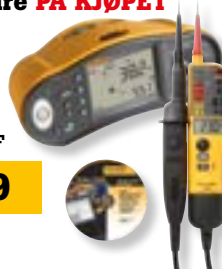
1663 SCH-TPL KIT/F