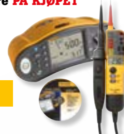
1664 SCH-TPL KIT/F